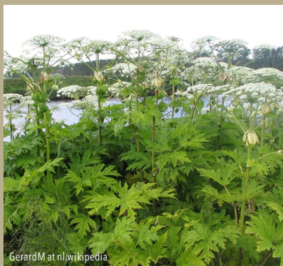
GerardM at nl.wikipedia

ACHTUNG! Giftiger Riesen-Bärenklau im Uferbereich. Vermeiden Sie Berührungen!